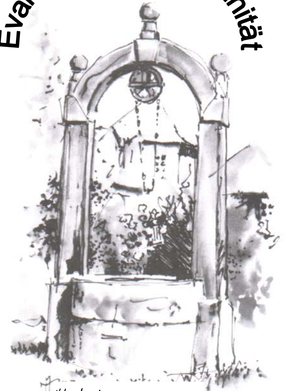
Illustration: M. Müntus

Unsere Häuser werden Brunnenhäuser sein, in denen das Wasser fließt, nicht verschlossen, sondern offen. Ich wünsche, dass viele kommen und trinken und selber Quellen des Lebens werden.